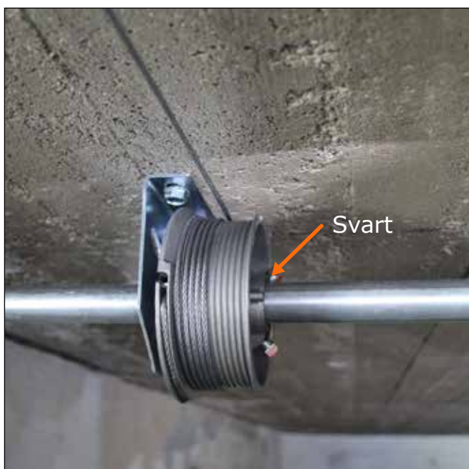
Bildet viser høyre side.