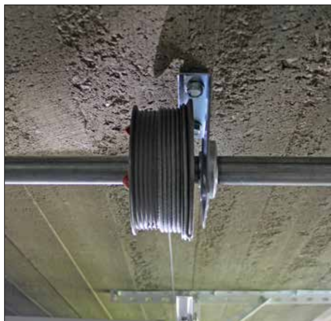
Monter lagerbrakett på linje med horisontale skinner.