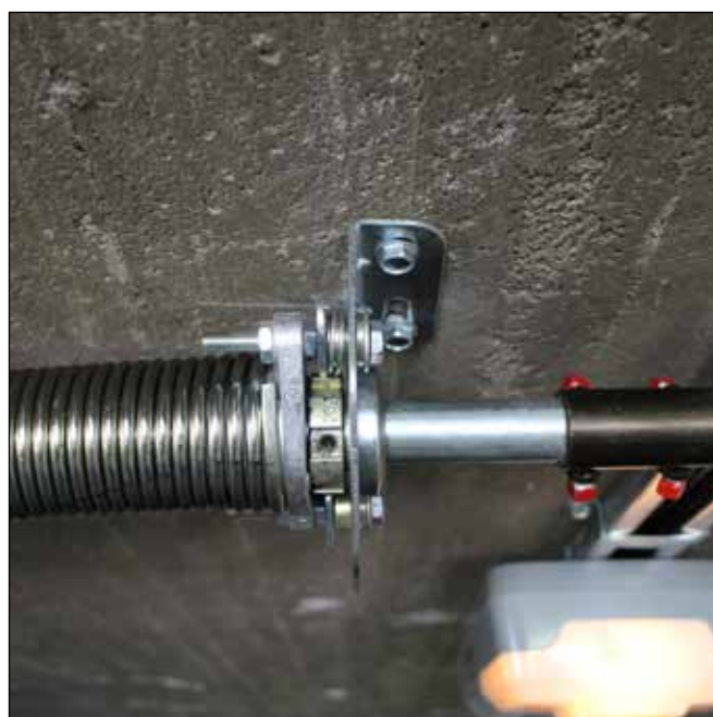
Bildet viser fallsikring.