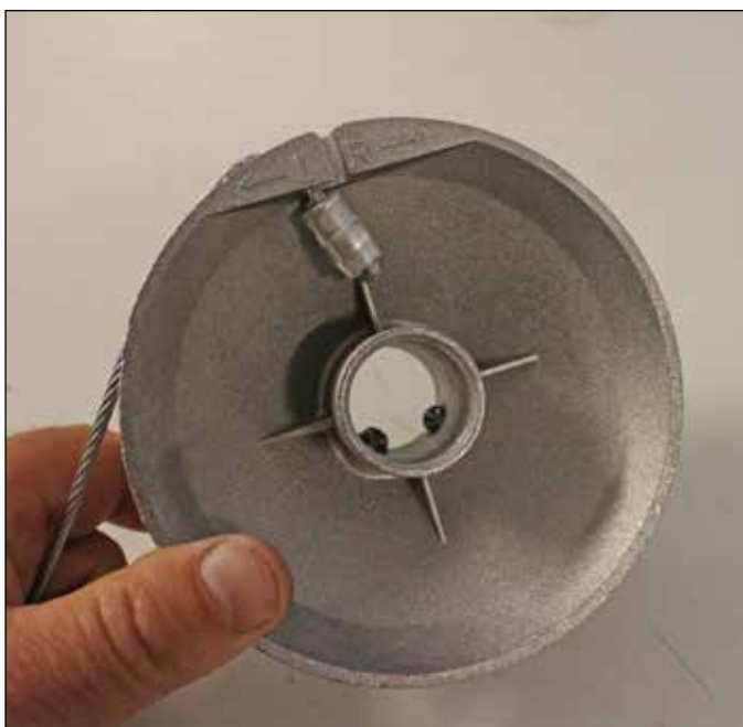
Bildet viser venstre wiretrommel.