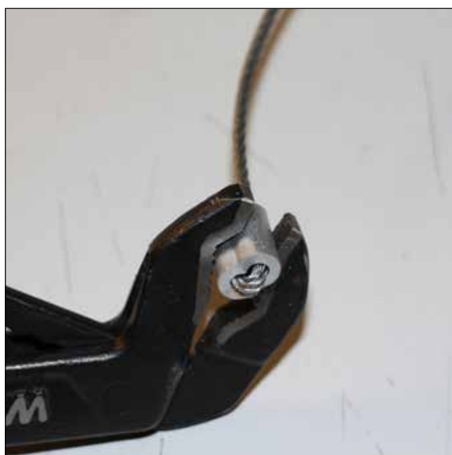
Klem fast wirelås som vist på bildet.