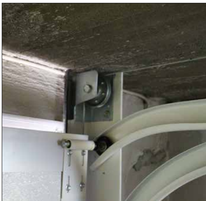
Legg wiren over baktorsjonshjul.